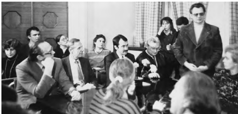
1988 m. Žurnalistų sąjungos būstinėje (Pylimo g.) aptariant Sąjūdžio veiklos skleidimą.