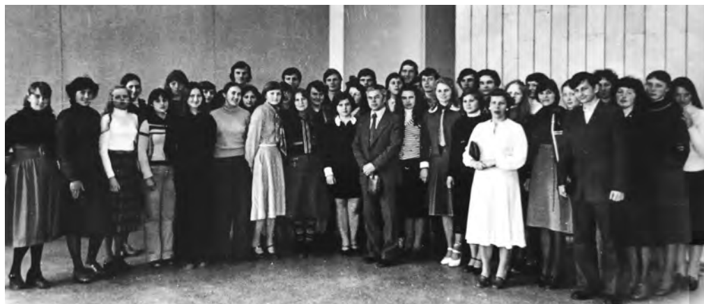
1979 m. Menininkų rūmuose (dab. prezidentūroje) man buvo įteiktas TSRS žurnalisto bilietas Nr. 60552; dabartinio LŽS nario bilieto Nr. 00113.