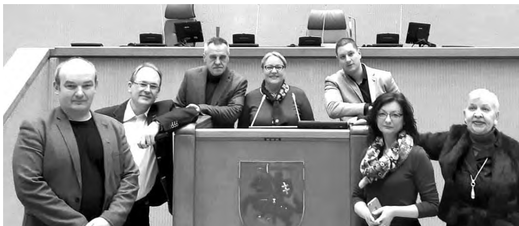
LŽS Klaipėdos apskrities skyriaus nariai, konferencijos dalyviai.

„Smalsaujame, reaguojame ir keliaujame, patiriame ir pasakojame jums. Mes – patyrę fotožurnalistai, multimedijų kūrėjai bei dokumentinių pasakojimų profesionalai, taip pat vykdančys įvairius kūrybinius projektus. Savo dėmesį skiriame išskirtinėms istorijoms ir originalioms jų formoms, laikydamiesi