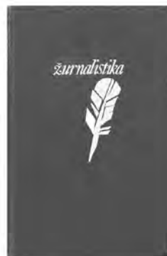
Lietuvių ŽS leidiniai.