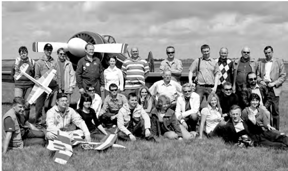
Spaudos diena KITAIP Rojūnų aerodrome 2009 m. gegužės 8 d.

Žmonės dažniausiai domisi ne viena sritimi, ne išimtis ir aš, menas mano akiratyje yra nuo jaunumės. Aš jį pastebiu, o jis irgi mane pastebėjo... Susipažįstant su lietuvių dailininkų kūryba ilgainiui neatlaikė nervai – norėjau ką nors nuveikti meno populiarinimo srityje, pasidalyti. Kai pati tiek daug gaunu, lengva dalytis.