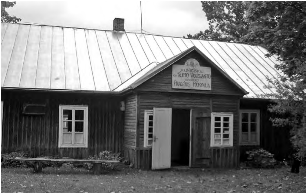
Kunigiškių pradinė mokykla, kurią lankė būsimasis literatūros klasikas.

„Nenusimanau, kur mano baigias beletristika, o prasideda publicistika...“