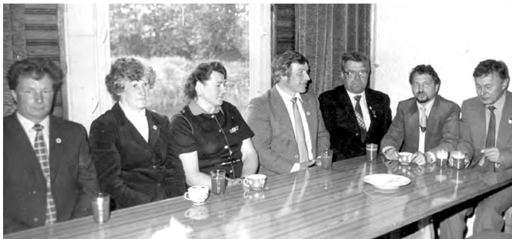
Rajoninių laikraščių darbuotojų seminaras Skuodo rajono laikraščio redakcijoje. 1982 m.

gerai išmanė. Jis suprato, kad žurnalistų darbo kokybė daugiausia priklauso nuo dviejų dalykų – profesionalumo lygio ir darbo sąlygų gerinimo.