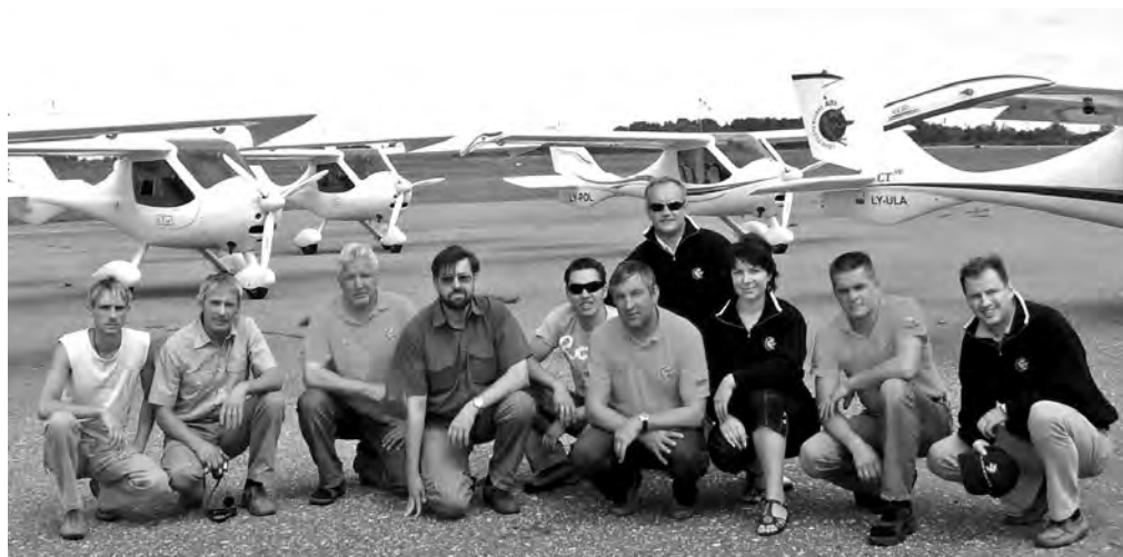
2007 m. žygio „Aplink Lietuvą be nutūpimų“ „5-CT“ lėktuvais dalyviai.