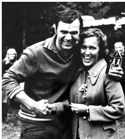
Baltarusiai prie Naručio ežero dažniausiai mus pasitikdavo su šampanu. 1975 m.

Kaip atsakinga ir pozityvi žurnalistė, susiformavau „Komjaunimo tiesoje“, kuri tuo metu tiražą skaičiavo šimtais tūkstančių egzempliorių. Trečiame kurse buvau pakviesta į Mokyklų ir studentų skyrių. Čia